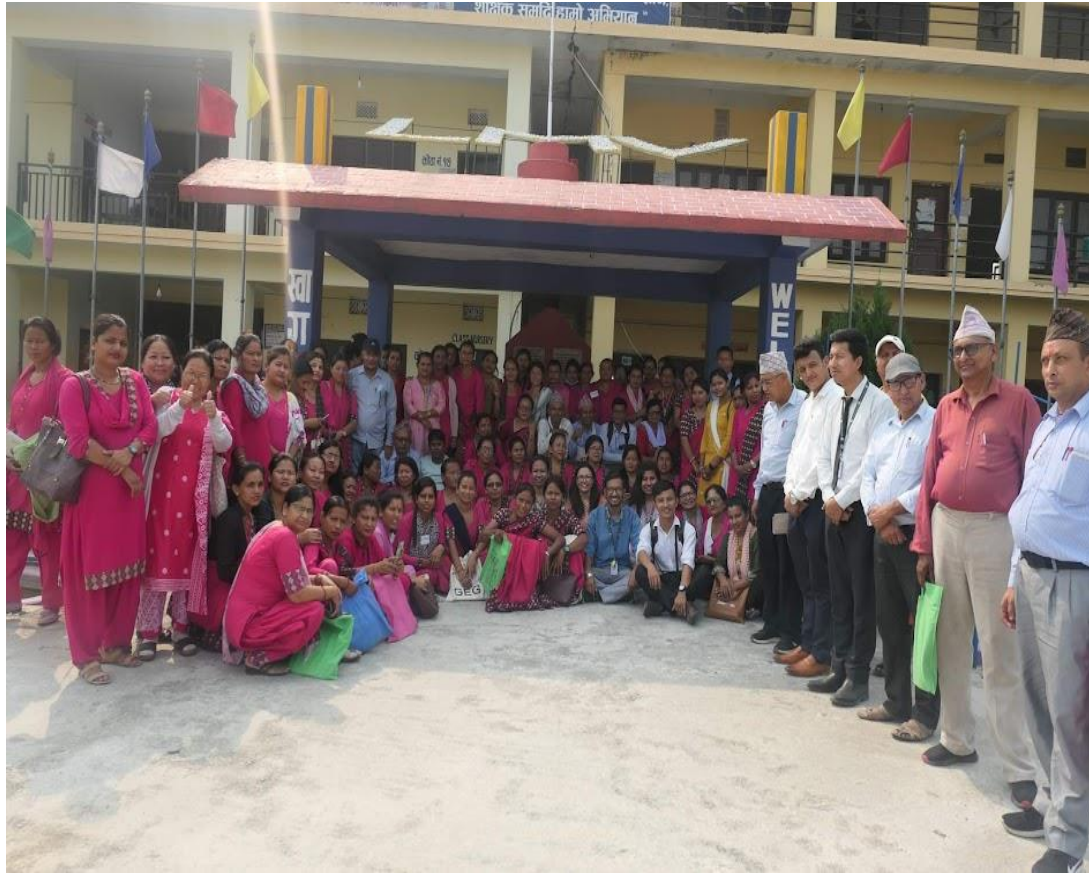
ईसिईसिई तालिम सहभागिहरु