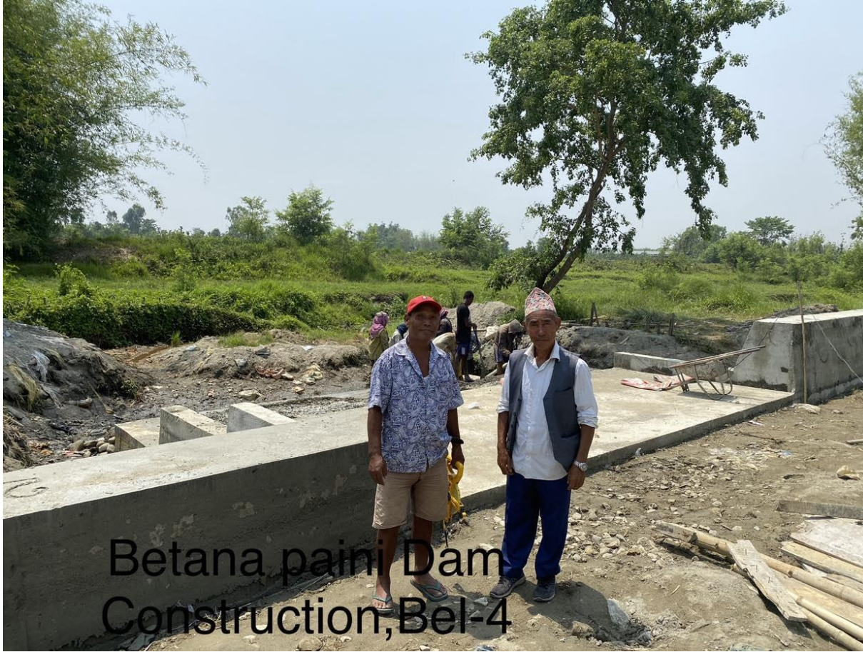
Betana paini Dam Construction, Bel-4