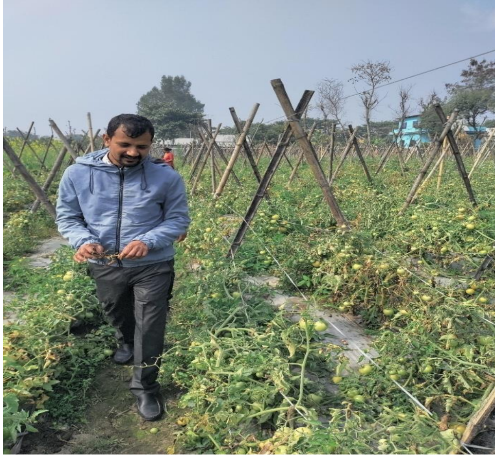
टमाटर खेती प्रवर्धन