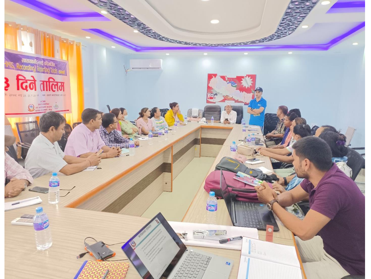
स्वास्थ्यकर्मीहरुलाई HMIS Reporting/ Recording सम्बन्धि तालिम