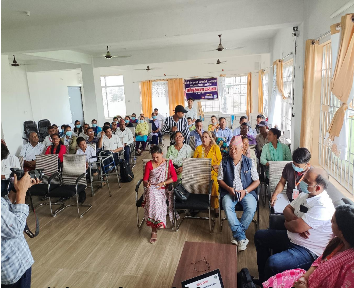
नसर्ने रोग सम्बन्धि जनप्रतिनिधिहरुलाई अभिमुखिकरण