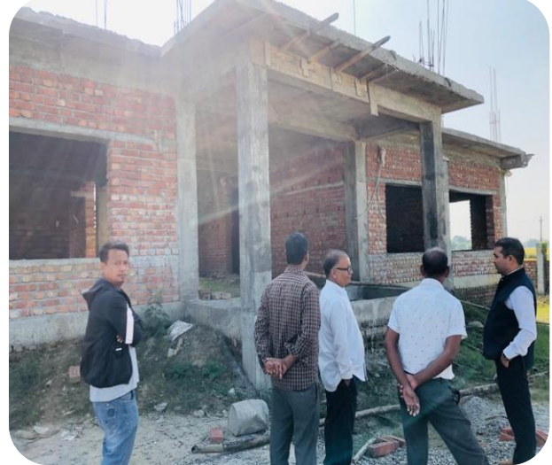
जि.स.स.मौज्दात कोषबाट लागत साझेदारीमा लेटाङ नगरपालिका र केराबारी गाँउपालिका मोरङमा संचालित योजनाहरुको अनुगमनका क्रममा लिइएका तस्बिरहरु ।