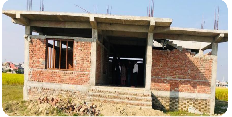
ख. बुढिगंगा गाँउपालिका २ नं वडा कार्यालयको प्रशासनिक भवन